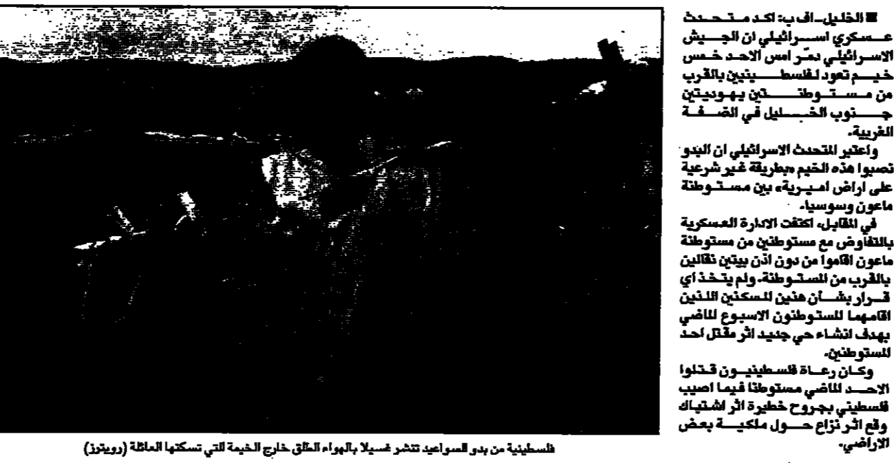
فلسطينية في بدو السوادية تنشر غسلا بالهواء الملق خارج الخيمة التي تسكنها العائلة